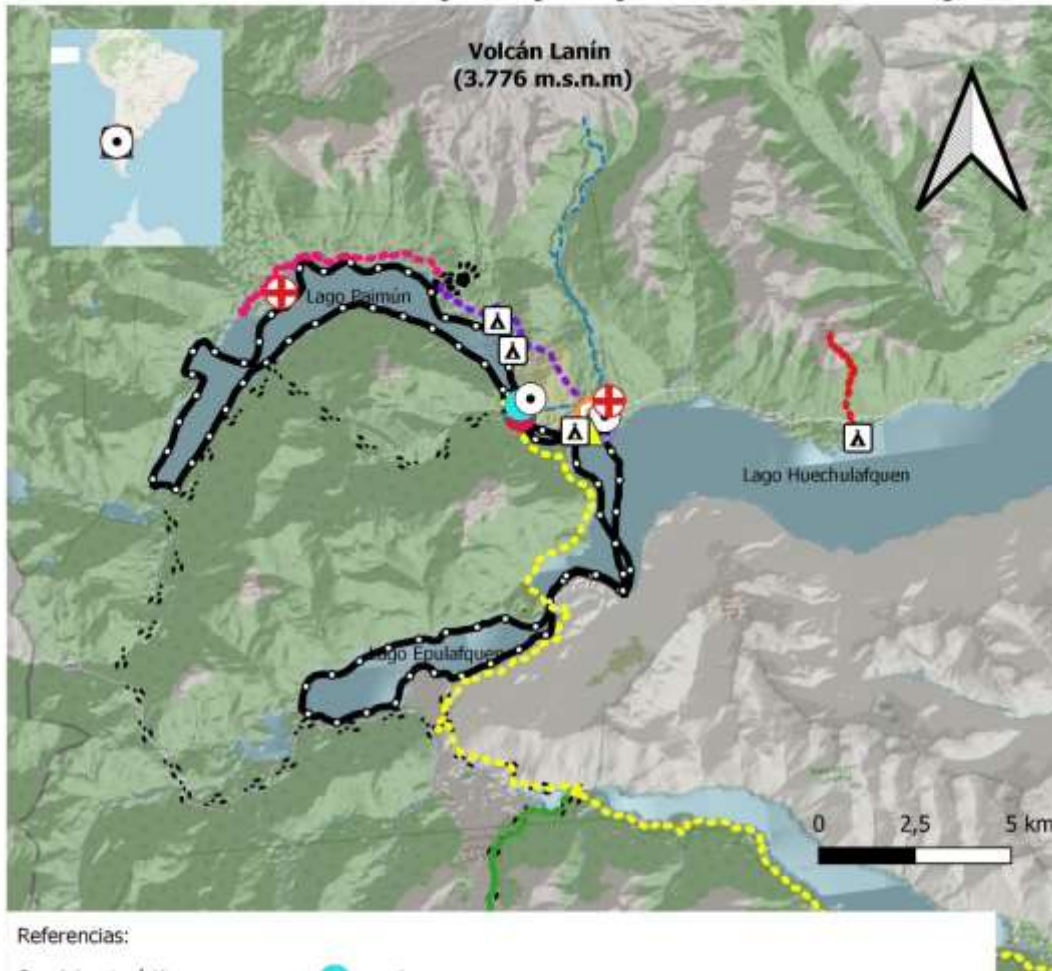
Figura 1. Mapa de distribución de oferta turística en la cuenca Huechulafquen (Parque Nacional Lanín)

Por ello, se debería analizar diseñar senderos de menor inclinación, ya sea redefiniendo nuevos accesos a los atractivos o bien creando otros para ampliar la oferta.