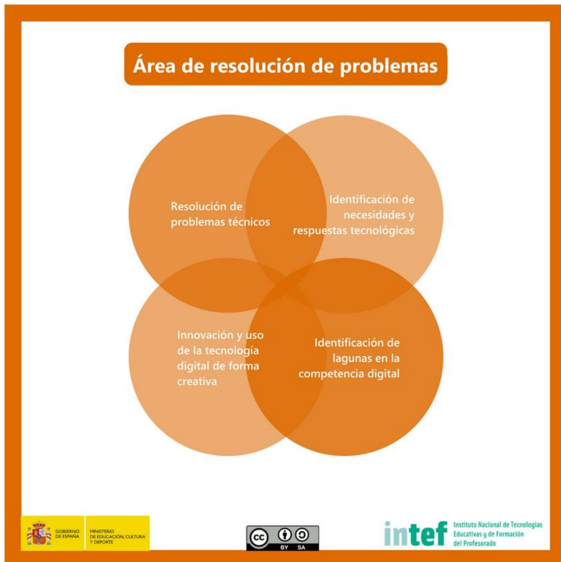
Figura 7 - Área de resolución de problemas

Identificar necesidades de uso de recursos digitales, tomar decisiones informadas sobre las herramientas digitales más apropiadas según el propósito o la necesidad, resolver problemas conceptuales a través de medios digitales, usar las tecnologías de forma creativa, resolver problemas técnicos, actualizar su propia competencia y la de otros.