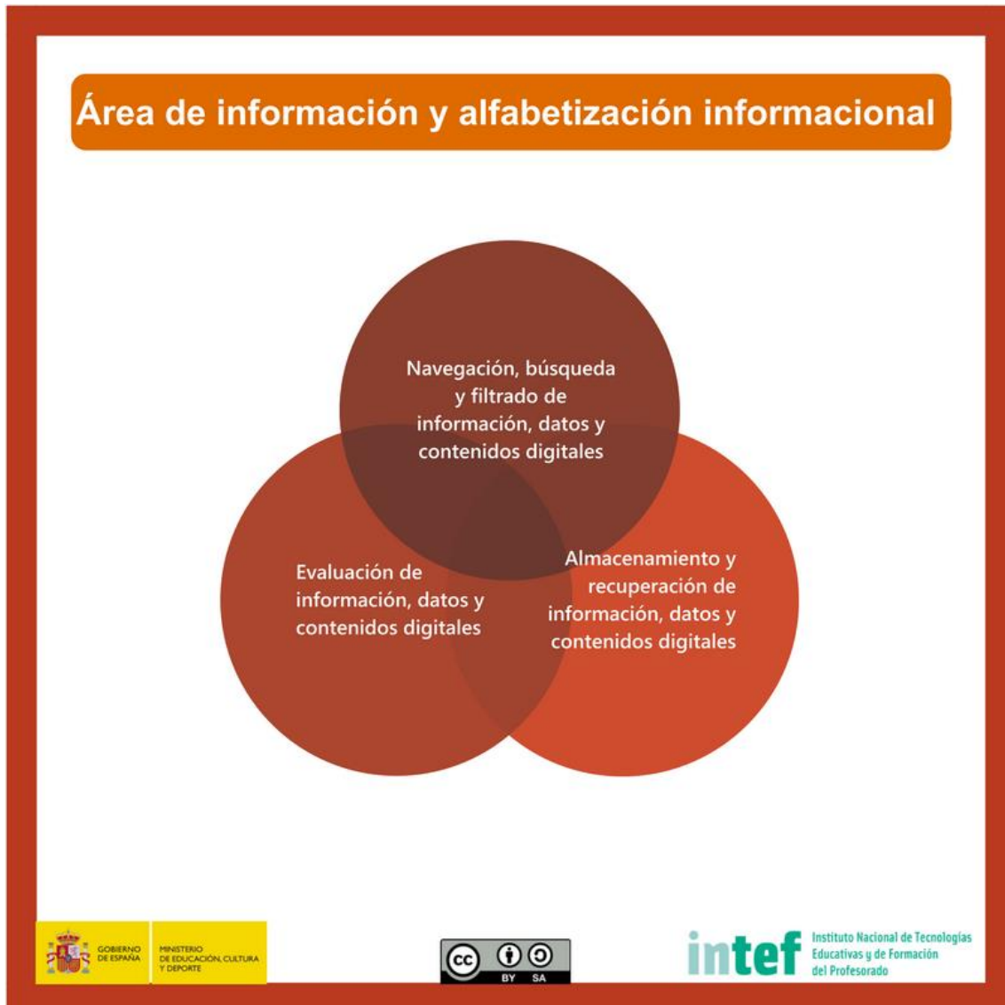
Figura 3 - Área de información y alfabetización informacional

Identificar, localizar, obtener, almacenar, organizar y analizar información digital, datos y contenidos digitales, evaluando su finalidad y relevancia para las tareas docentes.