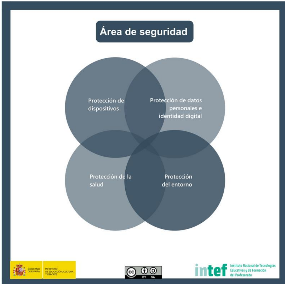
Figura 6 - Área de seguridad

Protección de información y datos personales, protección de la identidad digital, protección de los contenidos digitales, medidas de seguridad y uso responsable y seguro de la tecnología.