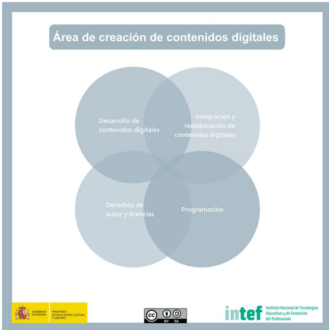
Figura 5 - Área de creación de contenidos digitales

Crear y editar contenidos digitales nuevos, integrar y reelaborar conocimientos y contenidos previos, realizar producciones artísticas, contenidos multimedia y programación informática, saber aplicar los derechos de propiedad intelectual y las licencias de uso.