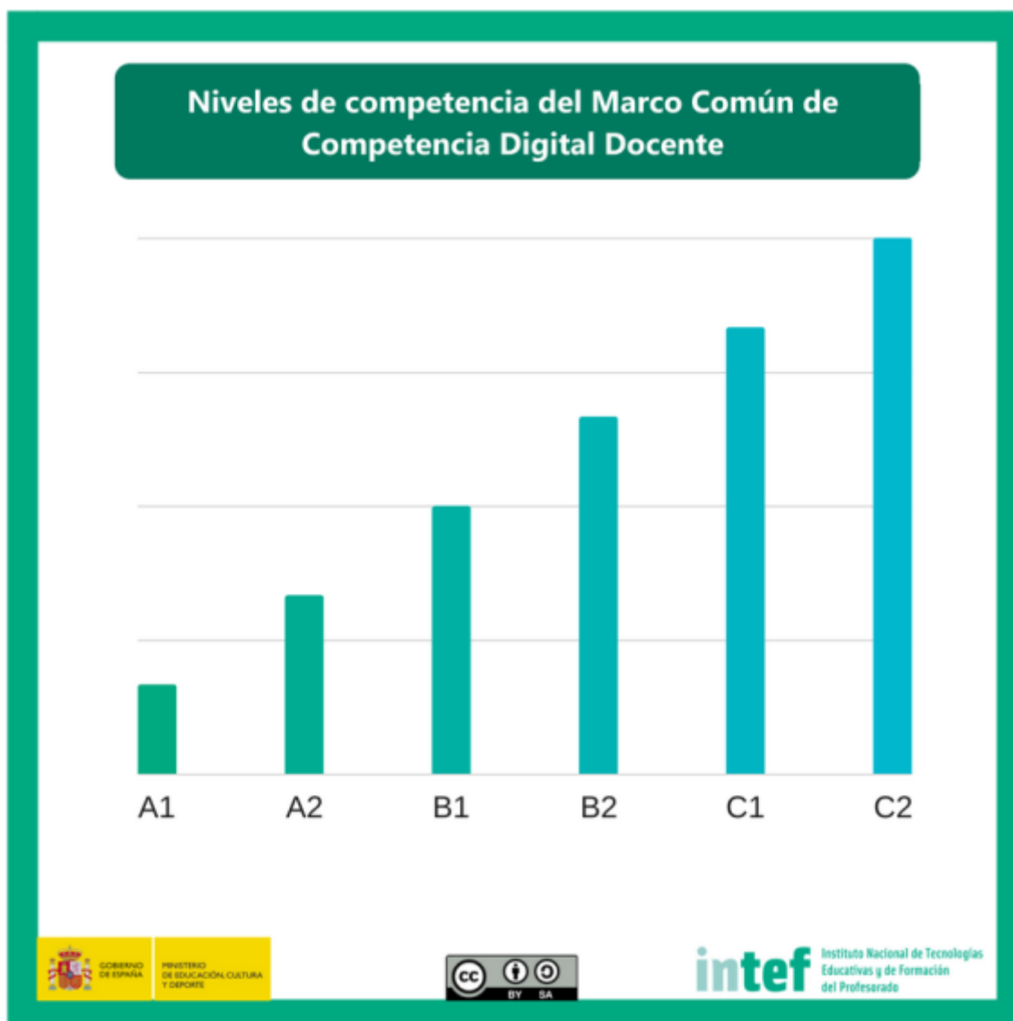
Figura 1 - Niveles competenciales

El Marco Común de Competencia Digital Docente establece tres dimensiones en cada una de las competencias de las cinco áreas que lo componen. La primera dimensión es básica, y en ella se incluyen los niveles A1 y A2. La segunda dimensión es intermedia, en la cual se incluyen los niveles B1 y B2. Por último, la tercera dimensión es avanzada, y la misma incluye los niveles C1 y C2.