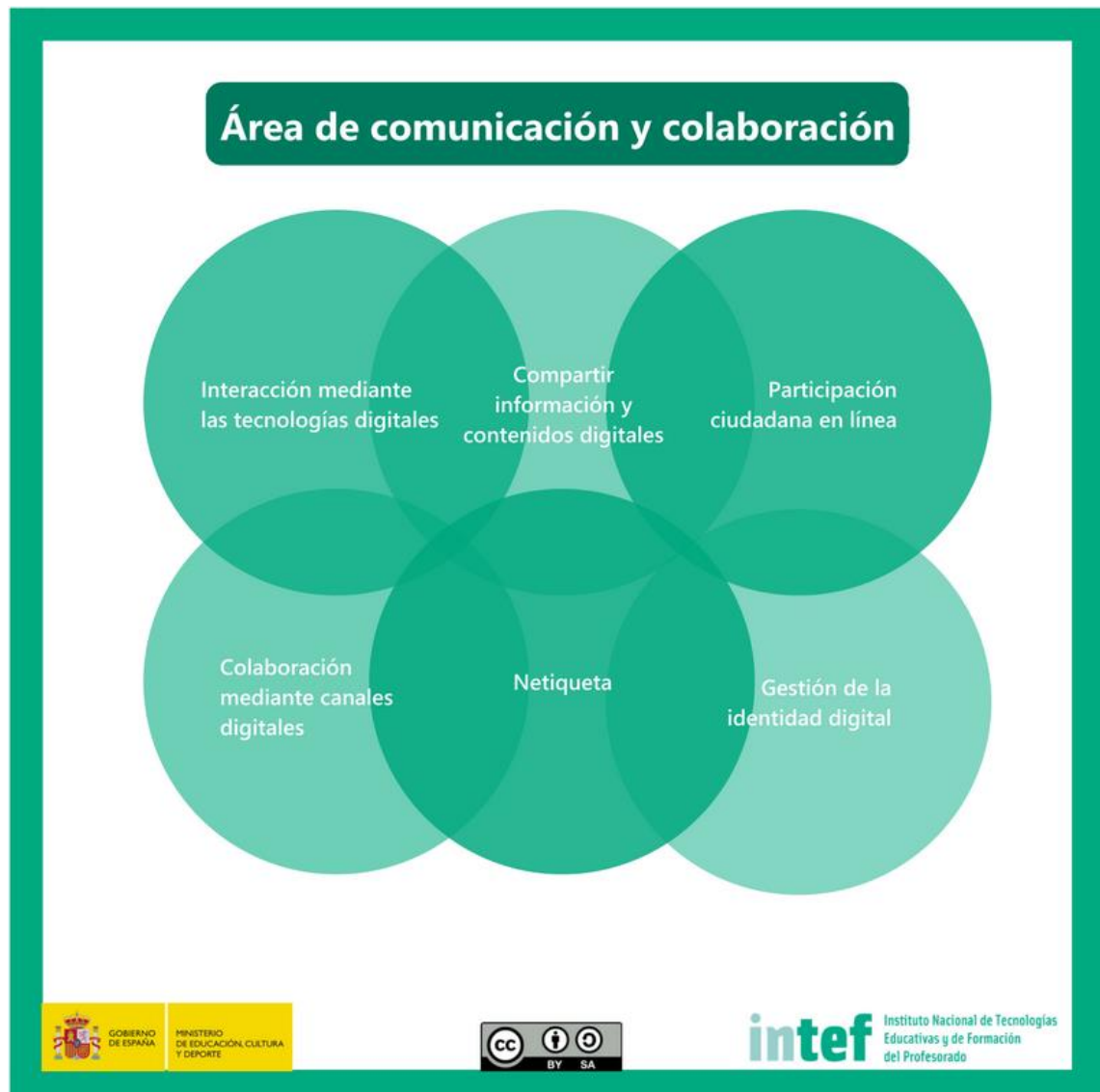
Figura 4 - Área de comunicación y colaboración

Comunicar en entornos digitales, compartir recursos a través de herramientas en línea, conectar y colaborar con otros a través de herramientas digitales, interactuar y participar en comunidades y redes; conciencia intercultural.