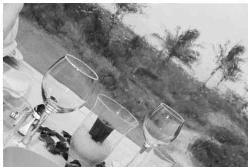
Los usos sociales del protocolo tienen como punto de referencia la historia, la política, la cultura la tradición.

El protocolo social se refiere a los actos de sociedad y familiares que no se consideran actos públicos. Son unas habilidades sociales que se transmiten de generación a generación y se refieren a personas o grupos que establecen unas pautas de convivencia y comunicación.