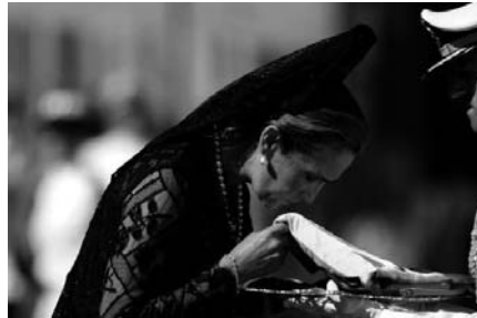
La infanta Dª Elena, tocada con mantilla, besa la bandera española que le tiende un militar.