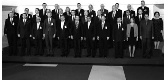
Foto de familia del Consejo de Ministros del Gobierno español en 2011.