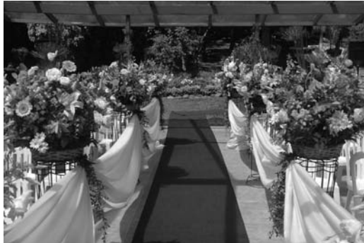
El acto más corriente donde se pone de manifiesto el uso del protocolo social es en las bodas, donde hay ciertas normas no escritas que se deben seguir.

En nuestro siglo, los usos sociales han cambiado a lo largo de los años y se plantea la necesidad de introducir nuevas maneras y nuevos usos, que surgen de otros modos de vida, cambios en las relaciones, la aparición de nuevas escalas de valores, las modificaciones experimentadas en el concepto de familia y el papel de la mujer en la sociedad.