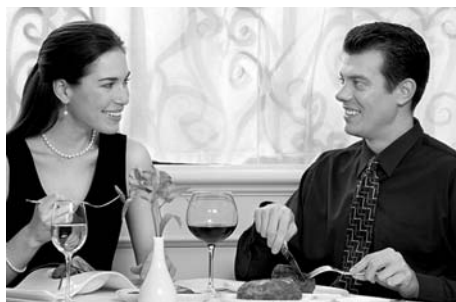
Es fundamental ser natural y no forzar los modales.

El protocolo actual, es un reflejo de las tradiciones y costumbres antiguas, que han ido evolucionando y modificándose a lo largo de los tiempos para adaptarse a los nuevos usos y costumbres de la época.