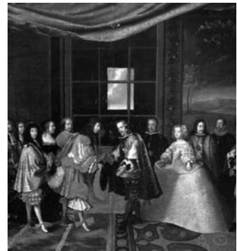
Otra definición de protocolo es el conjunto de reglas de cortesía y urbanidad establecidas para cada tipo de ceremonias.

Para otros autores, en cambio, la palabra protocollum proviene del griego protos (primero) y del latín collium , que significa cotejo.