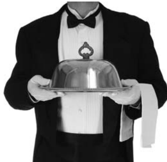
Plato cubierto por una campana

Los platos estarán cubiertos por una campana para preservarlos del frío y que mantengan su temperatura.