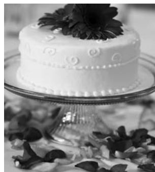
Ejemplo de decoración con flores

En cualquier caso y sea el centro que sea el que se utilice, deberán ser centros bajos que no impidan la visibilidad entre los comensales.