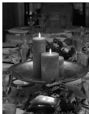
Es importante recordar que las velas solo deben utilizarse por la noche.

Si se utiliza una cubertería de plata o un bajoplateo metálico de color plateado, no se deberá utilizar ningún tipo de adorno de bronce o dorado.