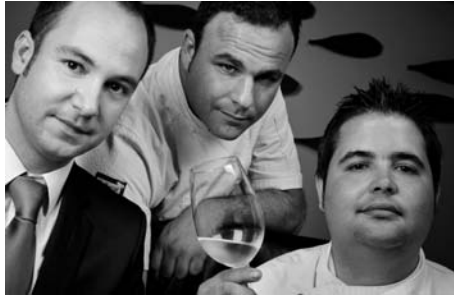
Si el cliente da su aprobación al vino que acaba de degustar, entonces se servirá a todos los comensales.

La copa de vino no se debe llenar demasiado para que no se caliente, de manera que una copa de vino blanco se llena \frac{2}{3} y una copa de tinto únicamente \frac{1}{2} .