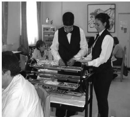
A la hora de servirse a la francesa, el comensal cogerá lo que se encuentre más cerca de su plato, sin elegir qué pieza le gusta más o qué verduras son de su agrado.

Es muy parecido al servicio a la inglesa, con la única diferencia de que el camarero trae la fuente con los cubiertos para servir y se los presenta al cliente por la izquierda, pero es el cliente personalmente el que se sirve la cantidad que desee.