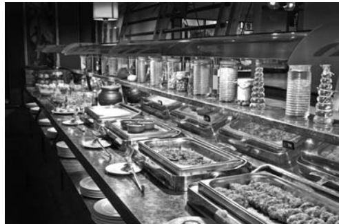
El buffet es un tipo de comida más informal que no está recomendado en las cenas de gala.

El buffet es una recepción con un mayor número de platos que un cóctel o recepción. Es una manera de que los invitados coman o cenen sin la necesidad de contratar tanto servicio como en una cena estándar. En el caso de que haya personal que se ocupe del buffet, este no tiene como cometido servir a los clientes, sino reponer las bandejas, recoger los platos y servir las bebidas.