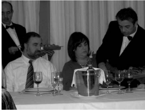
Servicio a la inglesa