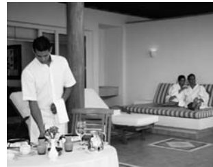
Desayuno servido en room-service

Si el servicio solicitado por el cliente es de un único plato, se deberá colocar este en el centro de la bandeja con los cubiertos a los lados y el vaso con la bebida, en la parte superior a la derecha. Si por el contrario, ha pedido más de un plato, deberá colocarse en el centro el primer plato y colocar a su lado todos los