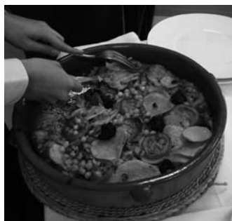
Servicio a la rusa

Este tipo de servicio se utiliza cuando se tiene que trinchar algún plato, preparar o flambear y conviene hacerlo frente al cliente. El camarero dispone de una mesa auxiliar a la cual lleva la fuente y allí prepara el plato y lo sirve a los comensales. La principal razón de usar este método es porque en apariencia el plato es más vistoso antes de servirlo (pescado a la sal, cochinito asado, etc.), porque sea un plato para compartir (paella, fideua, etc), porque necesita ser flambeado (crepes Suzette, etc.), o bien, porque su elaboración se realice delante del cliente (Steak tartare).