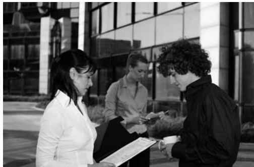
La mayoría de los coffee break son autoservicio, pero pueden estar atendidos por un par de camareros encargados, sobre todo, de reponer y ordenar.

El coffee break se sirve por la mañana o por la tarde y tiene una duración de no más de veinte minutos.