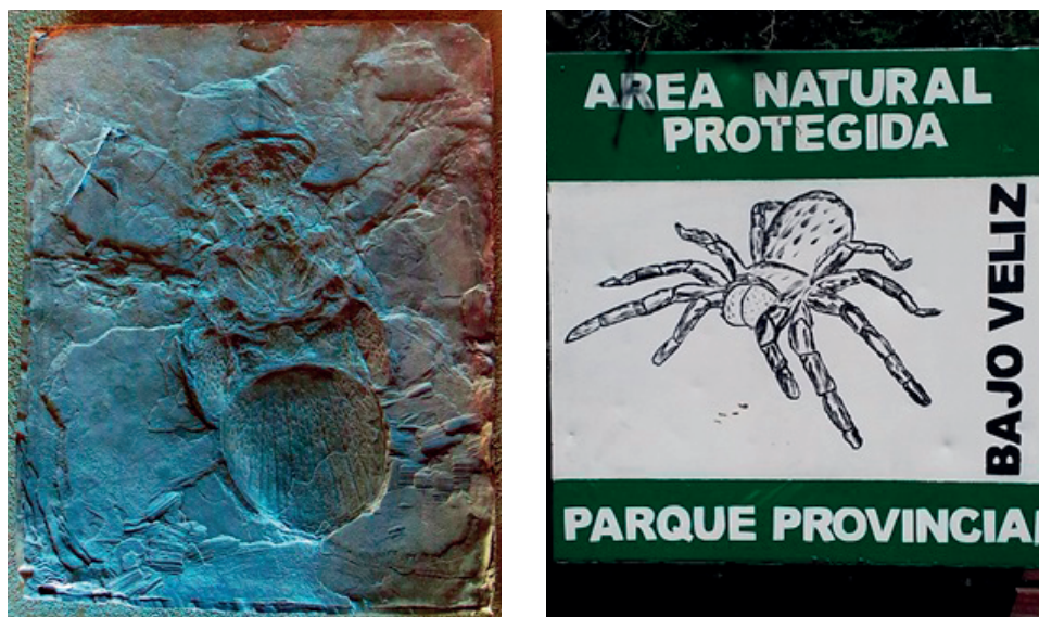
Figura 6. Fotografía del fósil original (izquierda) y su representación (derecha).

En el lugar, a los efectos del consumo turístico, resulta secundario si se trata de una araña o no, ya que así es promocionada, demostrando la penetración de una cultura visual (Mirzoeff, 2003) donde los arácnidos deben ser parecidos a sus versiones cinematográficas para ser considerados como tales. De todos modos, sobrevuela la inquietud por sobre su posible restitución, y la incomodidad de saber que no se cuenta con el fósil original para su exhibición. “Lo del parque es una boludez. Si al gobierno le interesara realmente traería la araña para acá, armaría un buen museo. Pero así uno se siente que está verseando, que es todo mentira”, sentencia uno de los miembros de la comunidad, consciente del grado de artificialidad de la propia práctica. Hoy el fósil es motivo de reclamo por parte del gobierno provincial, con el objetivo de reactivar el turismo en la zona 4 (Fig. 6).