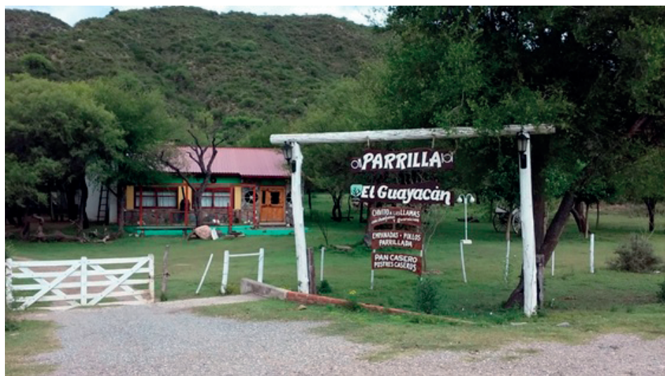
Figura 4. Contraste entre viviendas campesinas y parrilla orientada al turismo.