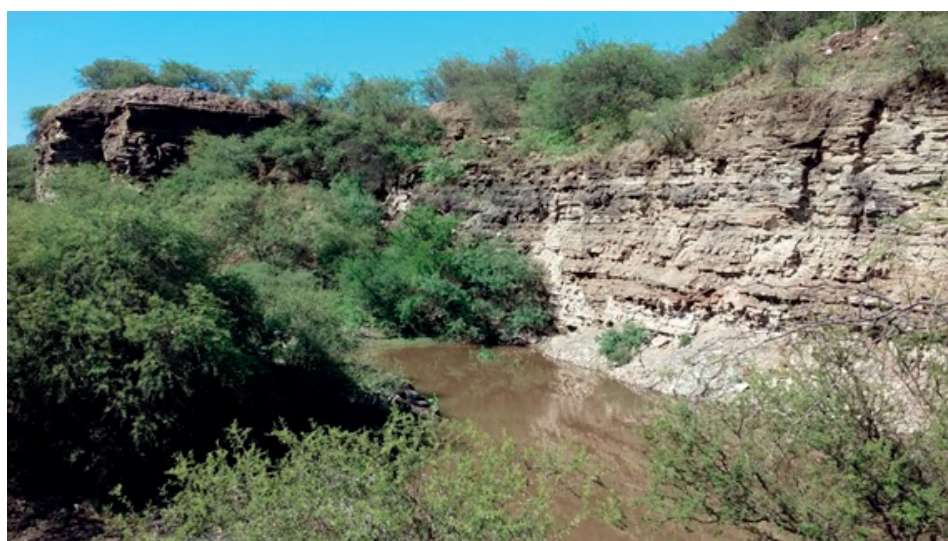
Figura 3. Huellas del conflicto: entrada (arriba) y paredón de la cantera (abajo). Fuente: fotografías propias, noviembre 2016.

La cinta asfáltica finaliza en una rotonda, de la que parten dos de los senderos marcados por la administración del parque. El primero va hacia uno de los sectores con presencia de morteros comechingones sobre el arroyo, y pasa por las inmediaciones de una de las casas. El segundo va hacia el Guayacán descrito en el plan de manejo. El tercer sendero es el que recorre la cantera abandonada, epicentro de los hallazgos paleontológicos de la zona. Su ingreso está sobre la ruta, poco antes de llegar a su final. Está delimitado por una tranquera, sobre la que, además de la cartelería turística, se encuentran carteles elaborados por la comunidad reclamando