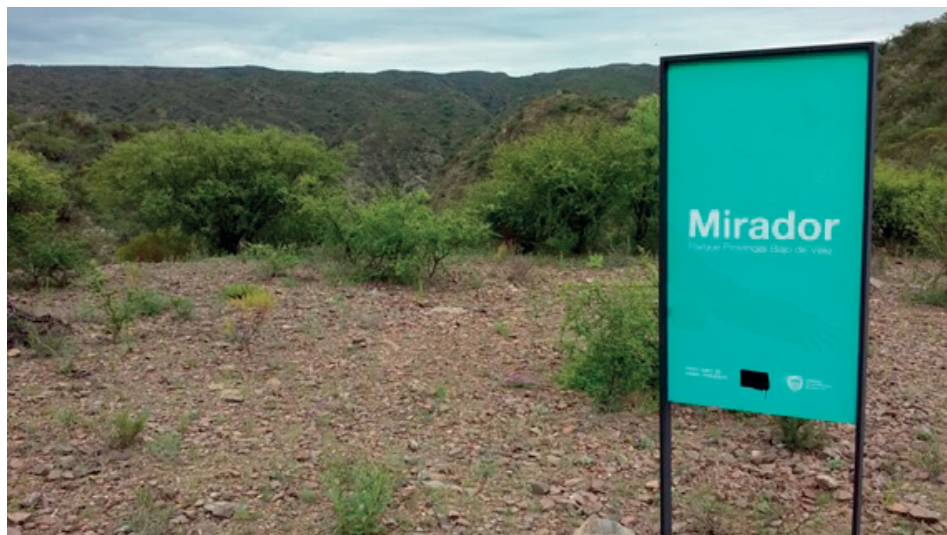
Figura 2. Mirador en la entrada al Bajo de Véliz.