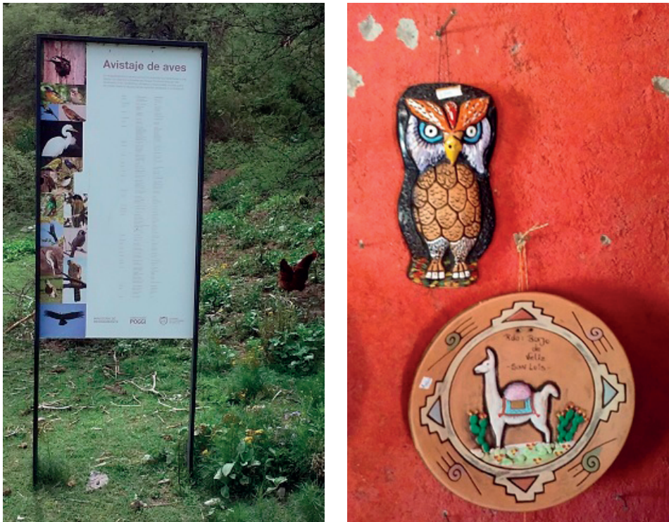
Figura 5. Cartelería oficial del Parque. Enumeración de especies ornitológicas autóctonas, que ignora las gallinas domésticas de las familias (izquierda) y productos a la venta en el puesto de recuerdos cercano al Guayacán (derecha).

El mismo es un emprendimiento informal que cuenta como principal atractivo una réplica del fósil de la “araña gigante”, símbolo del Bajo a pesar de su ya larga ausencia. La cuestión de la araña es particularmente interesante, dado que permite discutir la autenticidad y el carácter móvil de los atractivos turísticos, y cómo estos se pueden convertir en un signo representativo de un lugar, involucrando la industria del entretenimiento, la producción académica y el circuito de los museos de ciencias naturales.